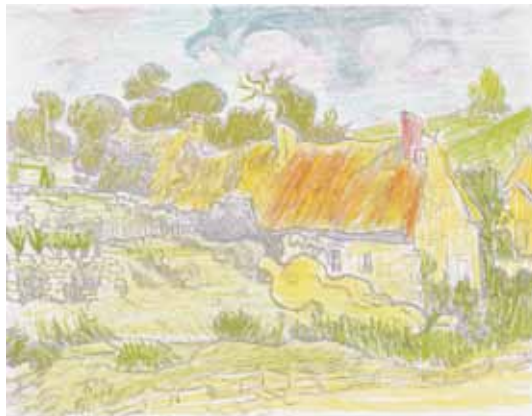
Séance 2 : une palette douce, les couleurs passées au crayon sont estompées