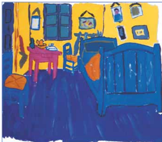
Séance 2 : modification des couleurs de la chambre de VAN GOGH