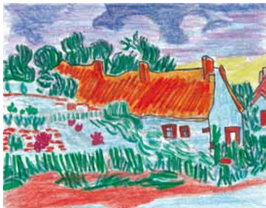
Séance 2 : une palette contrastée avec un travail aux crayons, rehaussé par de la craie et des feutres