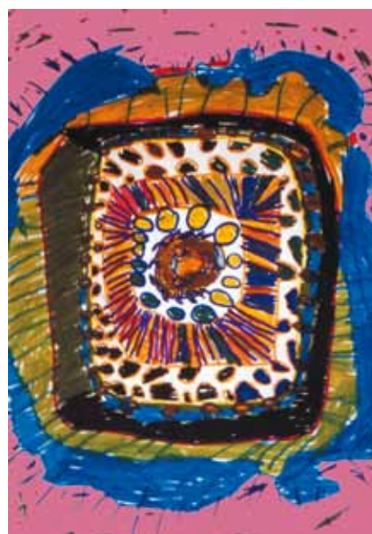
Mise en couleur