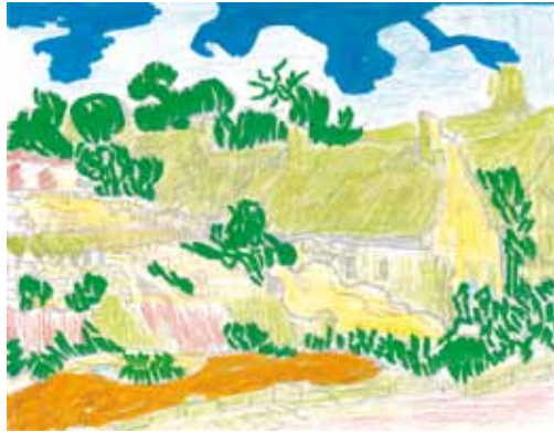
Séance 2 : mise en place des couleurs sur la trame du tableau de VAN GOGH, Chaumes de Cordeville , 1890, Musée d'Orsay