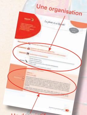
Un descriptif de déroulement

Ouvrage - 2011 - 256 p. Réf.: 31009A72 - 23 €